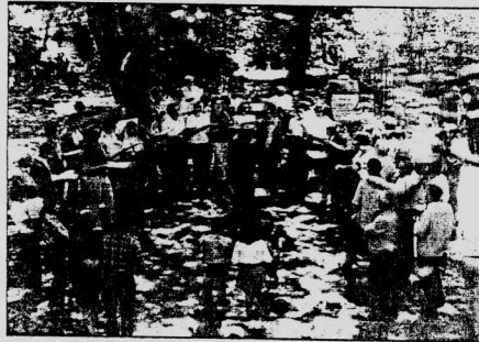
Coral Santa Cecília dirigida per Josep Freixas.