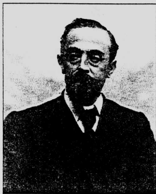
Joan Maragall i Gorina Barcelona 10/10/1860-20/12/1911